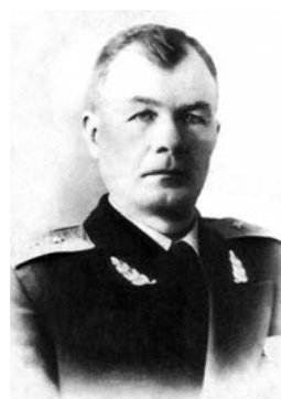
Шередега Иван Самсонович

Шередега Иван Самсонович (30.04.1904–12.05.1977), генерал-лейтенант НКВД СССР (затем — МВД СССР), советский государственный и военный деятель, начальник Главного управления местной ПВО МВД СССР (1949–1959), в последующем — командующий внутренними войсками НКВД СССР.