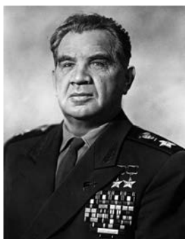
Чуйков Василий Иванович

Союза (1944, 1945), начальник Гражданской обороны СССР (1961–1972).