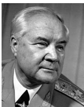
Говоров Владимир Леонидович

Говоров Владимир Леонидович (18.10.1924–13.08.2006), генерал армии (1977), советский военачальник, Герой Советского Союза (17.10.1984), начальник Гражданской обороны СССР — заместитель Министра обороны СССР (1986–1991).