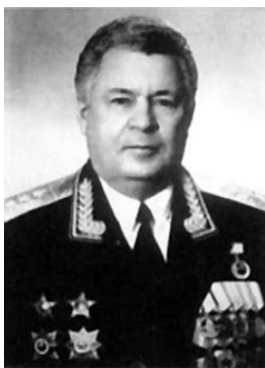
Пьянков Борис Евгеньевич

Пьянков Борис Евгеньевич (28.05.1935), генерал-полковник, советский и российский военачальник, начальник Гражданской обороны СССР — заместитель Министра обороны России (1991).