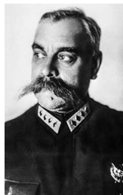
Каменев Сергей Сергеевич

Каменев Сергей Сергеевич (1881–1936), командарм 1 ранга, советский военачальник, начальник Управления ПВО Наркомата РККА — начальник Местной противовоздушной обороны страны (1934–1936).