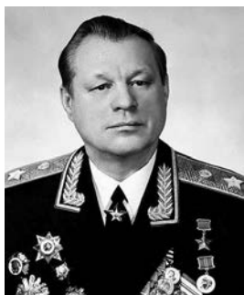
Алтунин Александр Терентьевич

Алтунин Александр Терентьевич (14.08.1921–15.07.1989), генерал армии (1977), Герой Советского Союза (1944), начальник Гражданской обороны СССР — заместитель Министра обороны СССР (1972–1986).