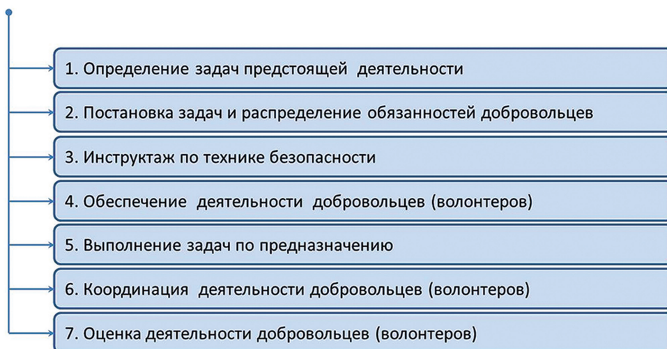
Рис. 3. Алгоритм действий добровольцев (волонтеров), осуществляющих деятельность по выполнению задач МЧС России

Проведенные исследования позволили выявить основные проблемы при организации добровольческой (волонтерской) деятельности, а именно: неэффективность мер социальной поддержки добровольцев;