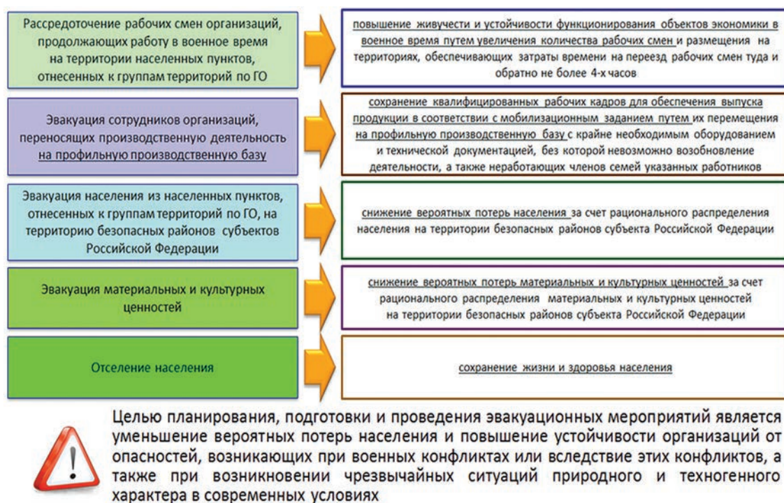
Рис. 1. Цели планирования, подготовки и проведения эвакуационных мероприятий в Российской Федерации

общей цели термина «эвакуационные мероприятия» является разнообразие целей, составляющих понятия, входящие в рассматриваемый термин.